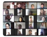
城市问题与城市更新