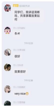
杨新军 陈佳 旅游地理与规划