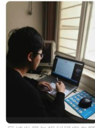
区域发展与规划研究专题