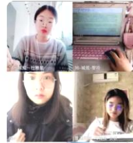
城市规划创新实践