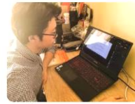
城市问题与城市更新